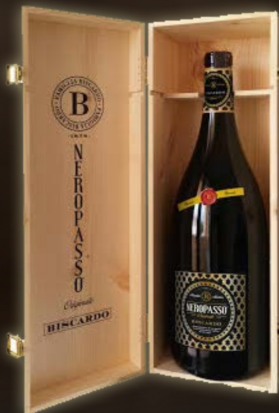
Neropasso Rosso Veneto Jerobaum 3L incl. kist