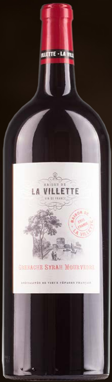
La Vilette GSM VdF MAGNUM