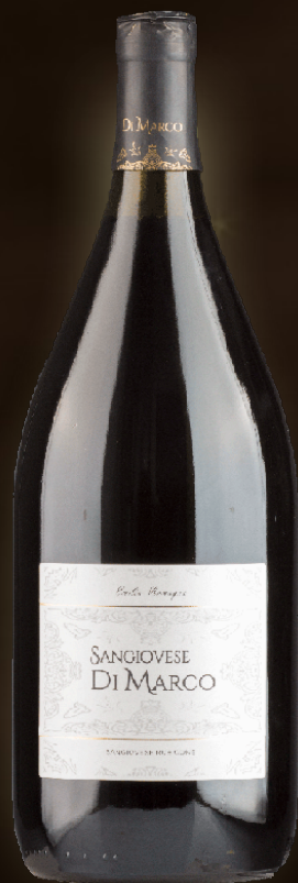
Rubicone di Marco Sangiovese Magnum