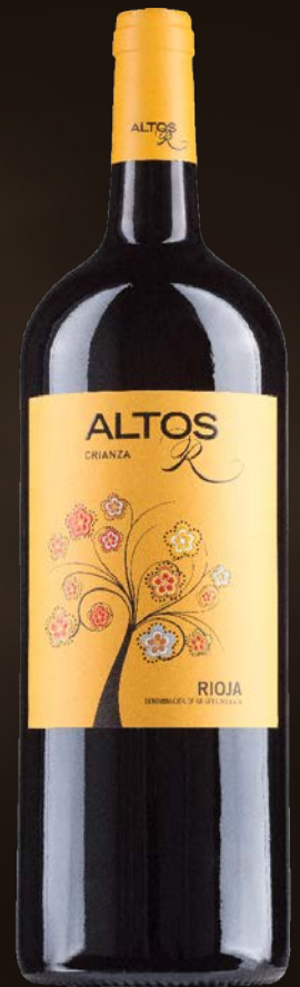
Altos R Rioja Crianza Magnum 1,5L