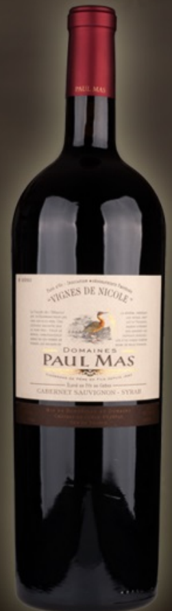
Paul Mas Vignes de Nicole Magnum 1,5L Cabernet Sauvignon / Syrah