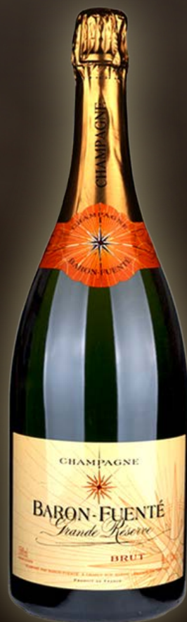
Baron Fuente Grande Reserve Brut Magnum 1,5L