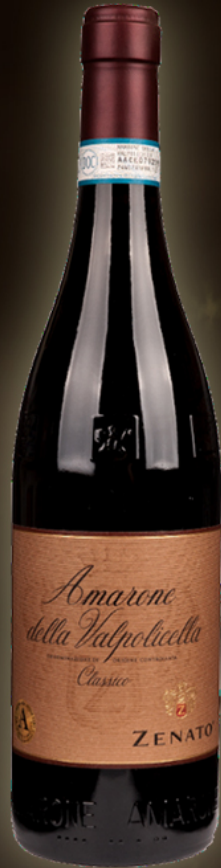
Zenato Amarone 1,5L