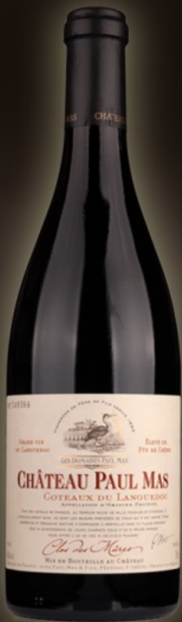
Chateau Paul Mas Clos des Mures Magnum 1,5L