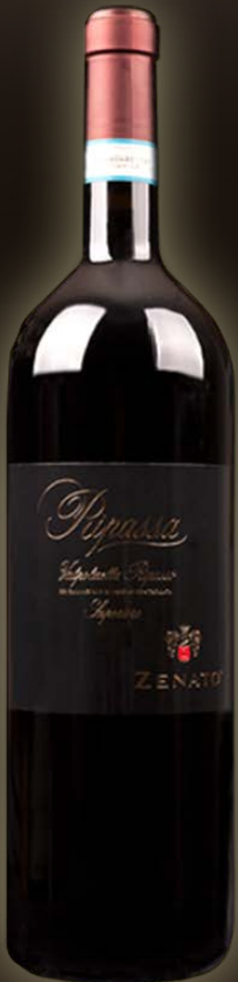
Zenato Ripassa 3 Liter in kist