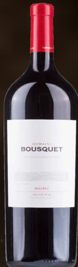
Domaine Bousquet Malbec Magnum 1,5L