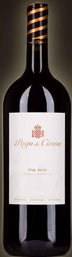
Pago de Cirsus Oak Aged Magnum 1,5L