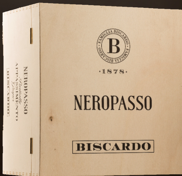
Neropasso Kist gevuld met 6 flessen Neropasso