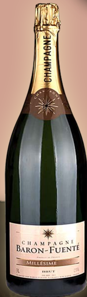
Baron Fuente Jerobaum 3LTR. in kist