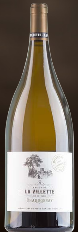
La Vilette Chardonnay VdF MAGNUM