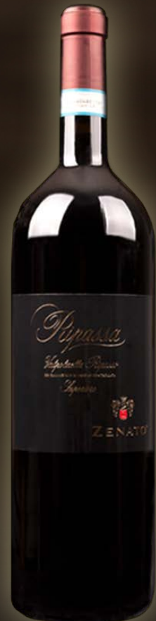
Zenato Ripassa 1,5L