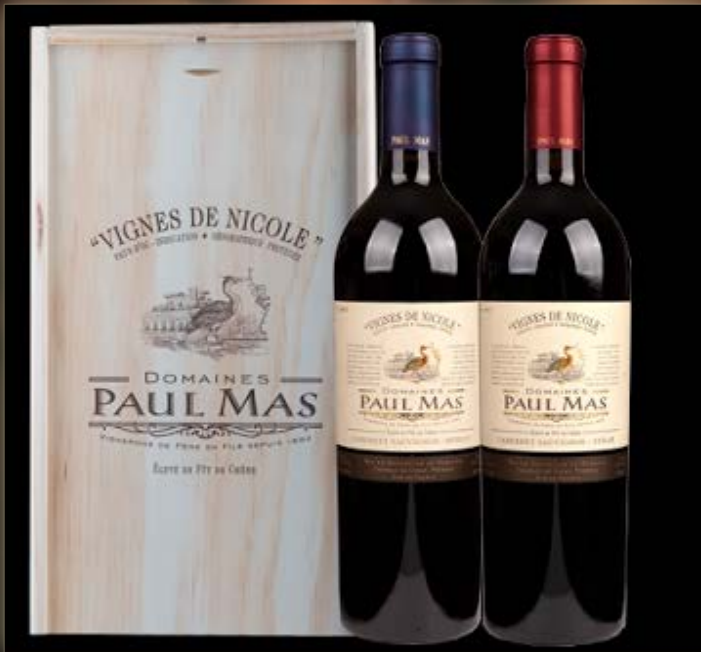
Vignes de Nicole 2-vaks Kist (incl. 2 rode wijnen)