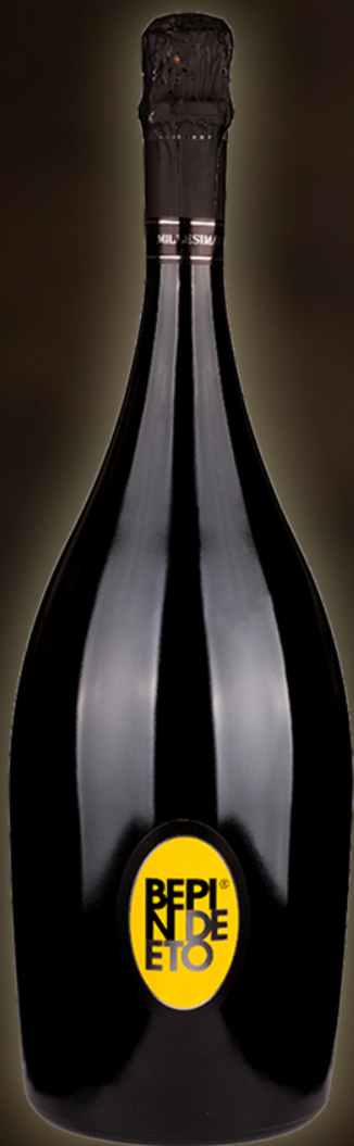
Bepin de Eto Prosecco Spumante Magnum 1,5L