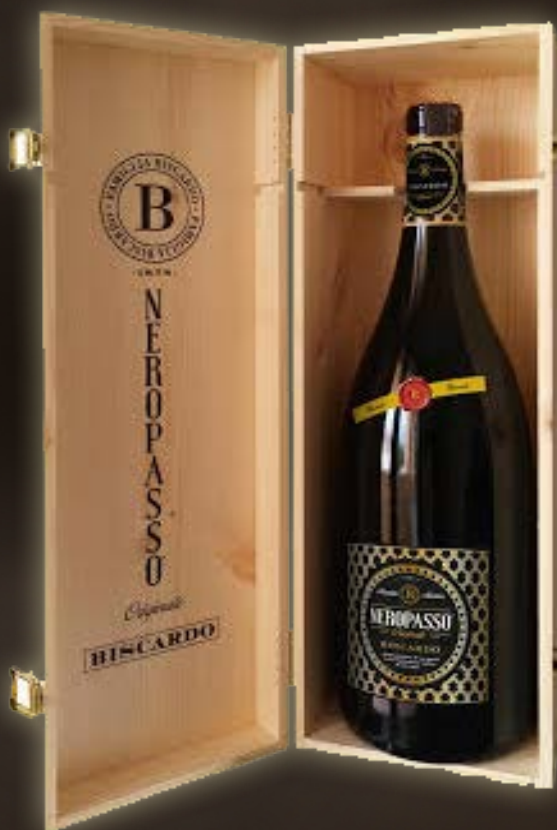
Neropasso Rosso Veneto Magnum 1,5L incl. kist