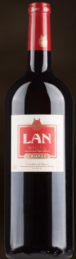
Bodegas LAN Crianza Magnum 1,5L in kist