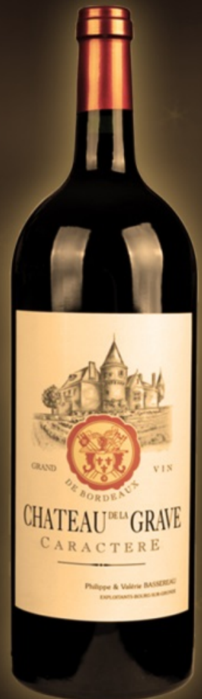
Chateau de la Grave Magnum 1,5L